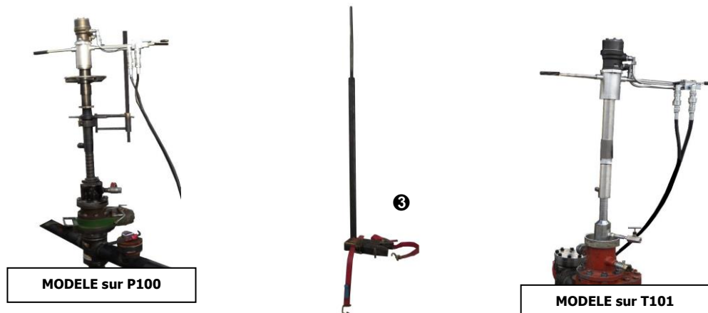
MODELE sur P100