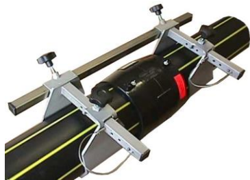
PM 90/200 EX - Manchon