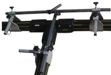
PM 90/200 EX – 3 Voies