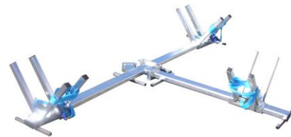
PM 160/450 – 3 Voies